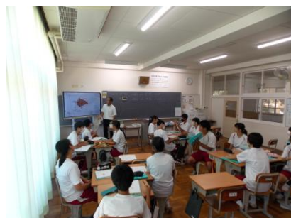
いじめ防止月間取組

三重県では、「いじめの防止等に関する県民の理解を深め、社会総がかりでいじめの問題を克服する」ため、毎年4月と11月を「いじめ防止月間（三重県いじめ防止条例18条2項）」と定め、取組を推進しています。