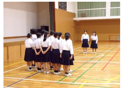
壮行会&新人大会の様子

「準優勝でした!」「先生、試合には負けたけど、貫けました!」など、何人かの生徒から試合後に声をかけてもらいました。目標として掲げていた結果を残せた生徒。試合に臨むにあたって大切にすべきことを貫けた生徒・・・大会を通して経験したことを今後の部活動や日常の学習活動に活かし、繋げていってほしいと思います。