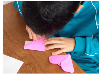
ハートブローチ制作中

文化祭でおこなった「ピンクのハートブローチ」の取組は、カナダの学生が起こした、いじめ防止の活動「ピンクシャツ運動」の理念のもとに取り組みました。いじめは人としての尊厳を踏みしめる許されざる行為です。今後も子どもたちとともに、いじめ防止への取り組みを推進していきます。