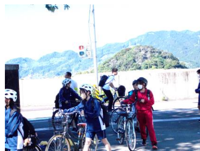
街頭指導(専門委員会)

この日は交通安全委員会による、街頭指導がおこなわれました。「おはよう！ここからは自転車を押してよ。」あいさつとともに“交通関係のきまり”を声掛けながら登校する生徒をむかえてくれていました。生徒会・各専門委員会の活動を通じて、『自治的能力』の育成を引き続き、推進していきます。