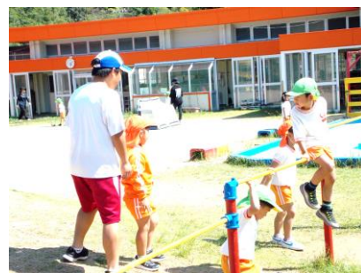
職場体験学習(2年生)

配属された事業所業務で本校への「配達」を担当していた生徒から「がんばってます！」と力強い言葉が返ってきました。その表情から、充実感や責任感がより強くなっていると感じました。