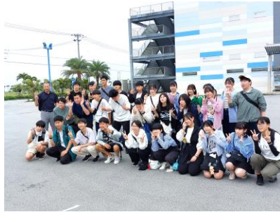
かりゆし水族館(1組)