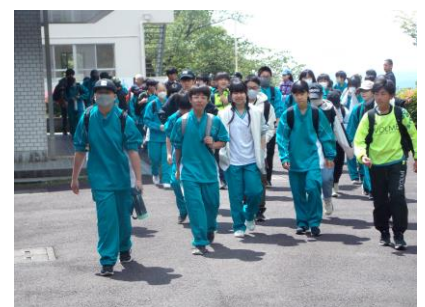
宿泊体験学習(1年生)

長尾山登山や野外炊事の場面では、互いに声を掛け合い、励まし合いながら活動する姿が見られ、子どもたちの成長を感じることができました。活動のしめは「学習会」。教室とは違う空間で自主学習などにしっかり向き合っていました。