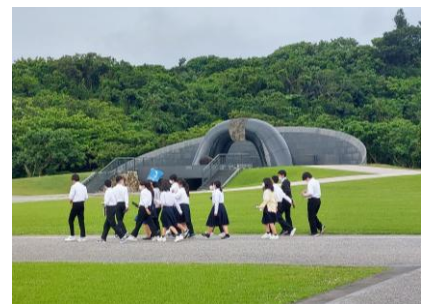
修学旅行(平和祈念公園)